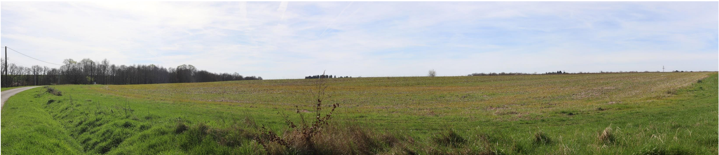
Figure 9 : Photomontage A – simulation avec projet – 120°

Le projet n’est pas visible sur cette simulation visuelle car il est entièrement masqué par la légère variation de relief située entre le point d’observation et le site d’implantation.