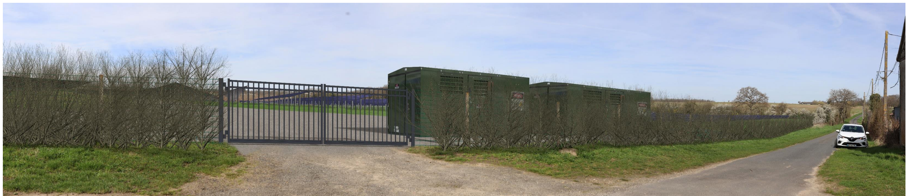
Figure 13 : Photomontage B (partie droite) – simulation avec projet – 120°

Le projet est ici perceptible de l'autre côté de la route. La haie située le long de la clôture filtre fortement les vues, mais les panneaux photovoltaïques et les postes techniques restent visibles en raison de leur proximité. Le portail crée une interruption ponctuelle dans la haie et une perspective plus ouverte vers le projet.