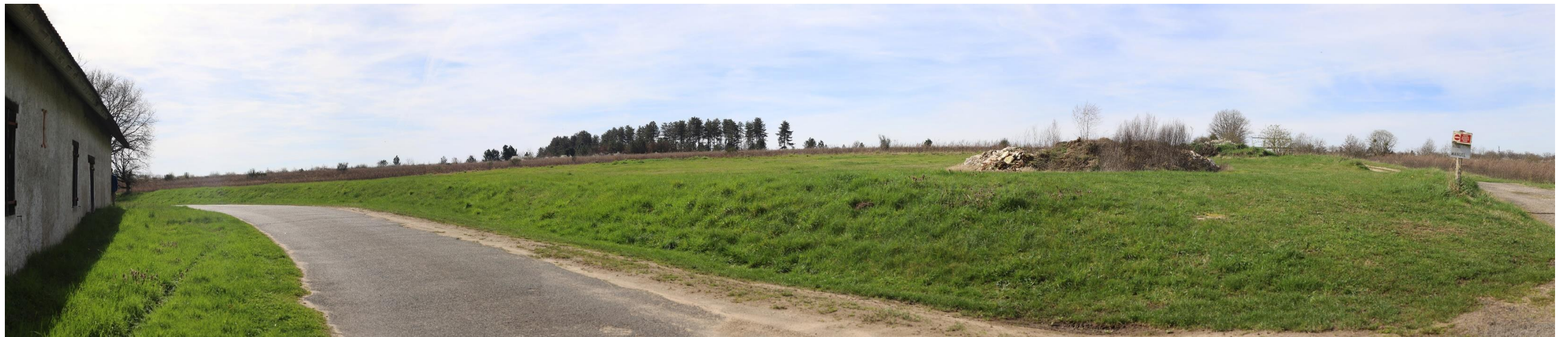
Figure 10 : Photomontage B (partie gauche) – état initial – 120°