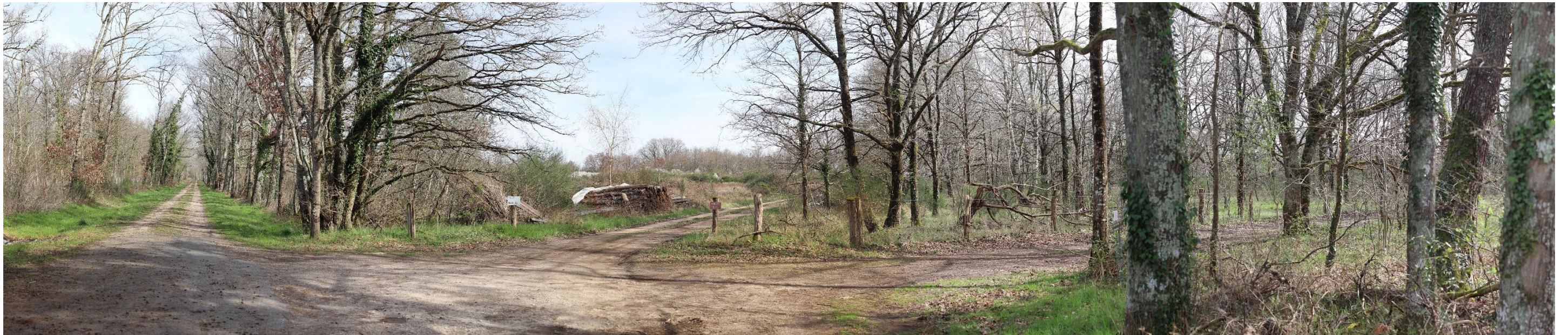
Figure 14 : Panorama C – état initial – 120°

Le contexte boisé de ce point de prise de vue met en évidence le fait que le projet n'est pas visible depuis ce lieu d'observation situé au sud-ouest du site d'implantation.