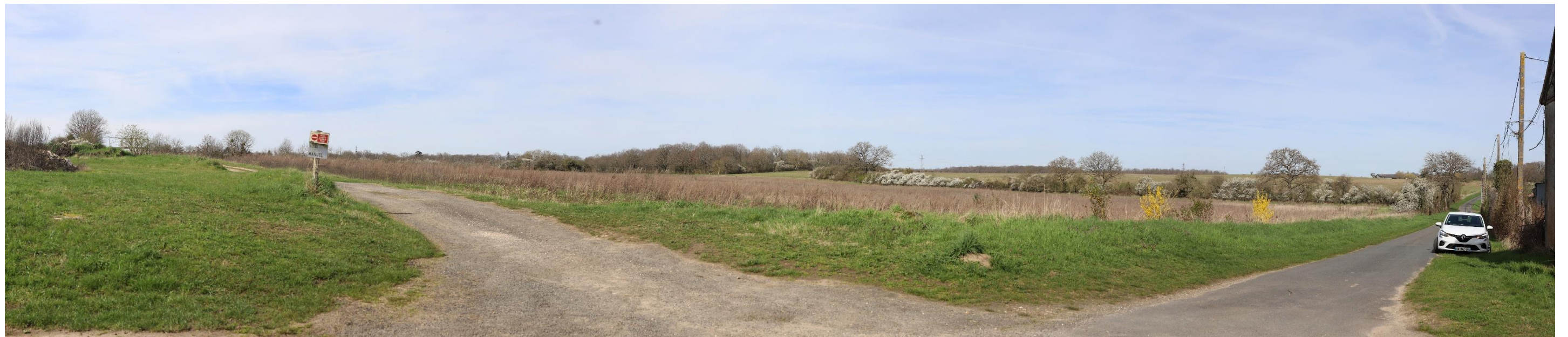
Figure 12 : Photomontage B (partie droite) – état initial – 120°