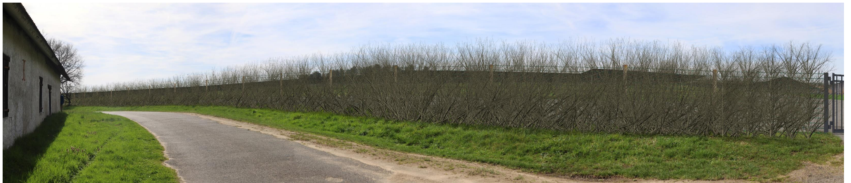
Figure 11 : Photomontage B (partie gauche) – simulation avec projet – 120°

Le projet est ici perceptible de l'autre côté de la route. La haie située le long de la clôture filtre fortement les vues, mais les panneaux photovoltaïques et les postes techniques restent visibles en raison de leur proximité. Le portail crée une interruption ponctuelle dans la haie et une perspective plus ouverte vers le projet.